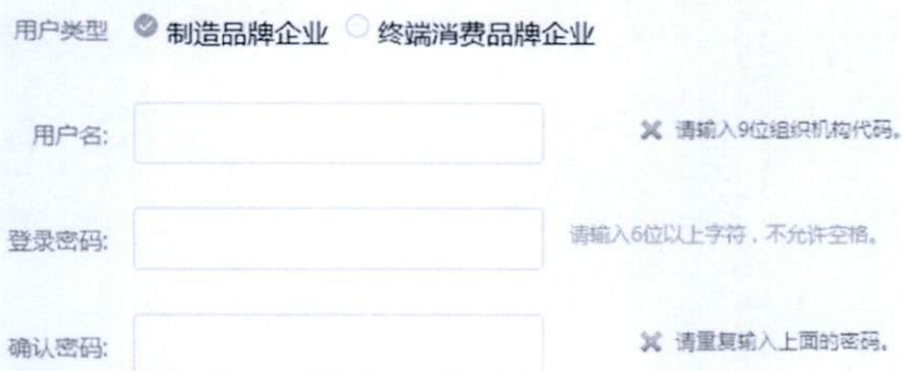
图 1-1 企业注册页面（上部分）